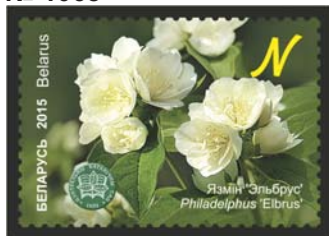
Язмін 'Эльбрус' (Чубушник 'Эльбрус')