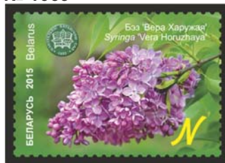
Бэз 'Вера Харужая' (Сирень 'Вера Харужая')