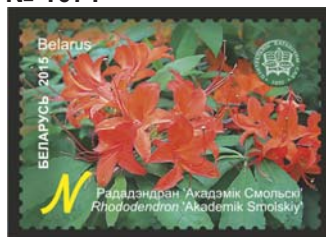
Рададэндран 'Акадэмік Смольскі' (Рододендрон 'Академик Смольский')