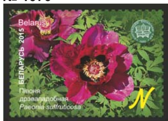
Півоня дрэвападобная (Пион древовидный)