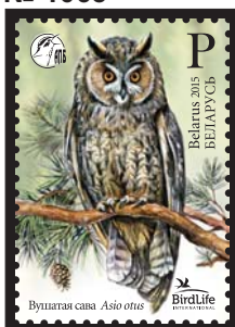
Вушатая сова (Ушастая сова)