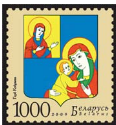
Герб Кобрына (Герб Кобрина).